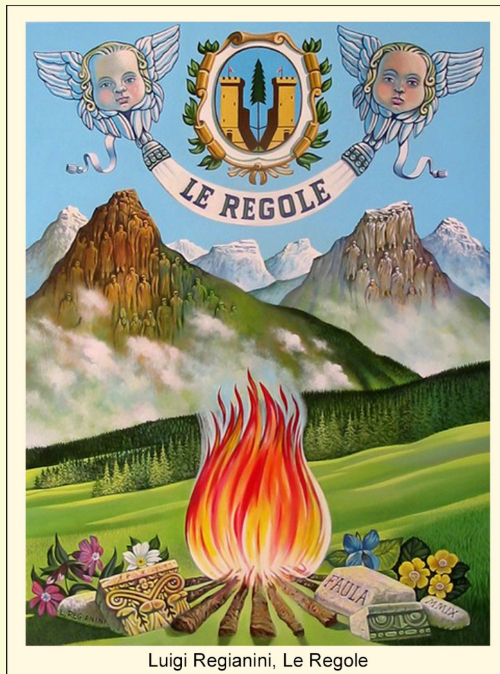
Luigi Regianini, Le Regole

http://museoregianini.altervista.org/-dolomythicwomen--10-maggio-.html