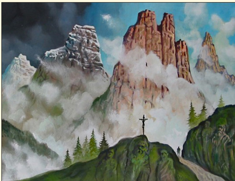
Luigi Regianini, Il Passo dei Santi

http://museoregianini.altervista.org/-walkingtales--3-maggio-.html