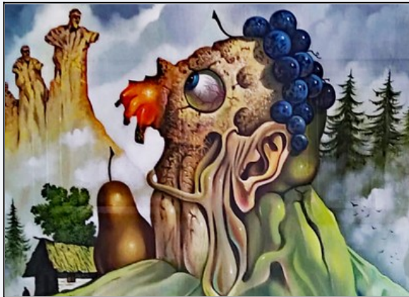
L. Regianini, La montagna incantata (partic.)