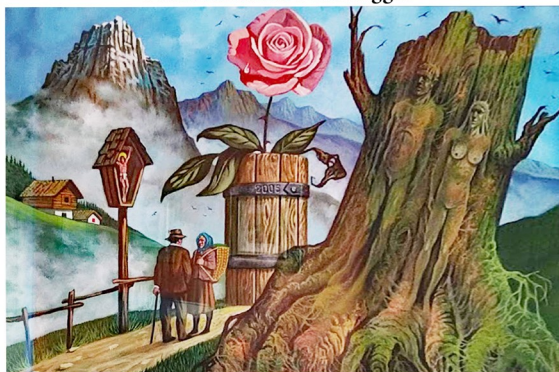
L. REGIANINI, Il fantastico Cadore, 2005, acrilico su tavola, cm 60x40